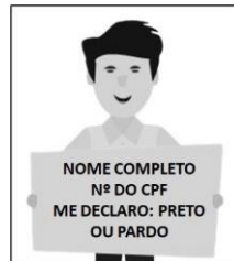
Figura 3. Modelo de Autodeclaração