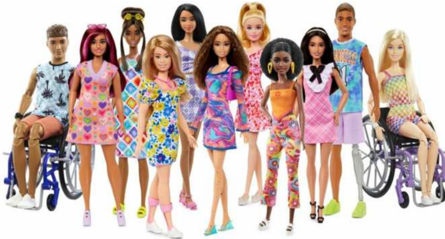
Imagem promocional de produtos da Mattel, da linha Barbie