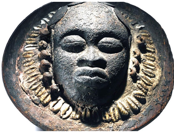
Figura 2. Bronze de Daomé a representar mulher com adornos