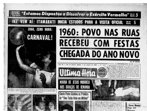
Figura 1. Capa do jornal Última Hora de 1960

06. (URCA/2025.1) Observe as duas imagens e leia as três manchetes de jornais brasileiros, sendo a primeira manchete do jornal carioca Última Hora , de 2 de janeiro de 1960; e as duas últimas manchetes publicadas no jornal paulista Folha de São Paulo , dos dias 12 e 13 de dezembro de 2024. Após a leitura, observação e análise, marque a alternativa correspondente: