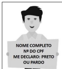
Figura 3. Modelo de Autodeclaração