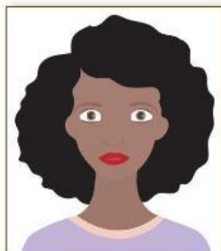
Figura 1. Modelo de Foto Frontal