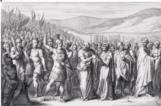
"A Secessão do Povo ao Mons Sacer", gravada por B. Barlocchini, 1849

No início do período republicano da Roma Antiga, a plebe enfrentava duras condições, tais como: não ter acesso aos cargos públicos e à justiça, não ter suas famílias reconhecidas pelo Estado, podendo inclusive ser escravizada por dívidas. Sobre a condição social em Roma no período republicano: