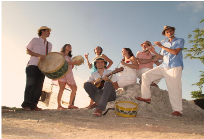
Figura 1: Banda Fulô de Aurora. Representação da formação de um grupo de "Forró de Raiz".

A partir da análise dos imaginários sonoros de sujeitos envolvidos em grupos musicais que “conservam” o forró tradicional e também do público que interage e reafirma que apreciam o forró “de verdade”, estabelece-se um discurso que hierarquiza através do gosto [1].