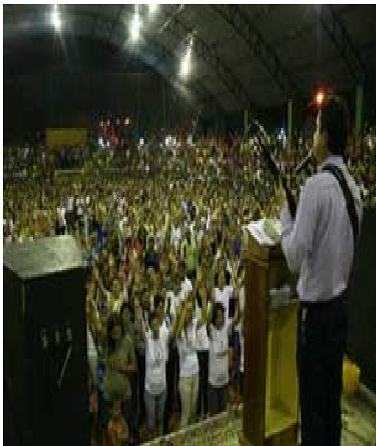
Celebração da Missão Resgate, na Quadra Bicentenária do Crato. (data da postagem 09.11.2008) Disponível em: http://diarionordeste.globo.com/materia acesso 23 de outubro de 2012.