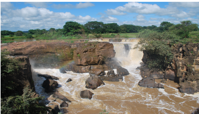
Foto: Geossítio Cachoeira de Missão Velha

O geossítio Cachoeira de Missão Velha, no Ceará, tem uma grande importância para o estudo das origens culturais do município e da região do Cariri. Os geossítios são locais que apresentam elevado interesse geológico pelo seu valor singular do ponto de vista científico, pedagógico, econômico, cultural, estético entre outros [1].